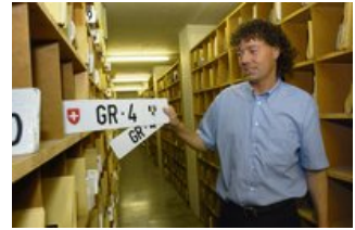
Tiefe Kontrollschilder sind auch in Graubünden gefragt.

Seit kurzem vermittelt die Pullmann AG aus Vaduz Auto- und Motorradnummernschilder. Solche verkauft das Strassenverkehrsamt Graubünden bereits seit Jahren. Eine Konkurrenzsituation sieht dieses darin allerdings nicht.